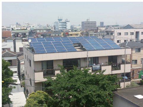
市民発電プロジェクト 「えど・そら」2号機

温暖化をもたらす温室効果ガスの中で最も多い二酸化炭素(CO 2 )は、エネルギーをつくる過程で生まれます。そこで、CO 2 を出さない再生可能エネルギーによる市民立発電所を建設し運営しています。